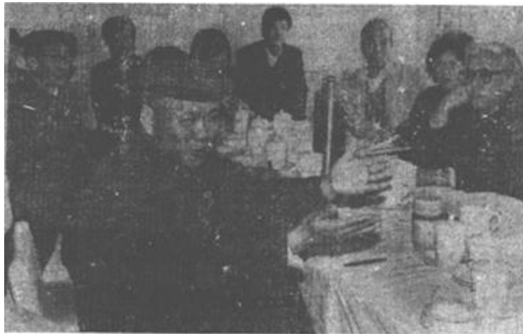
△ 3月17日下午，出席政协第二届东营市委员会第三次会议的各界委员分组审议常务委员会工作报告。图为民盟、九三学社委员们本着“肝胆相照，荣辱与共”的精神，坦陈己见，献计献策。

步完善统分结合的双层经营体制，建立健全社会化服务体系。有条件的地方，可根据群众自愿，稳妥地推行适度规模经营。企业改革，要继续坚持承包经营责任制，在总结实践经验的基础上，兴利除弊，不断配套完善。