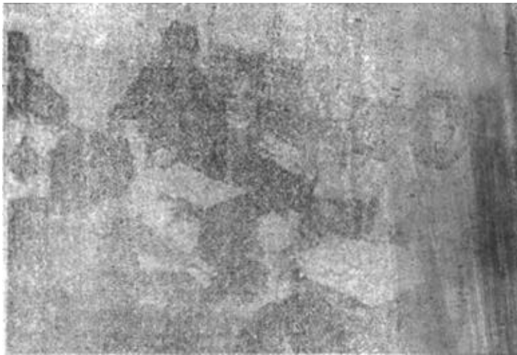
本版责任编辑 黄功霖

3月19日,出席市第二届人民代表大会第三次会议的代表们就市政府的三个报告分组进行审议讨论。代表们畅所欲言,提出许多有益的意见和建议。图为河口区代表讨论时的情景。